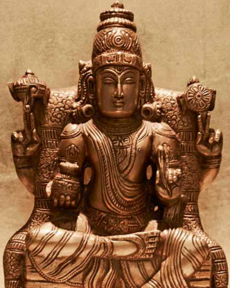
„Dhanvantari“, der Schutzgott des Ayurveda

Das „Wissen vom Leben“ („Ayus“ = Leben, „Veda“ = Weisheit), wie der Ayurveda auch übersetzt wird, gilt als die älteste Gesundheitslehre der Welt. Die Grundprinzipien des Ayurveda sind seine universelle Anwendbarkeit und sein holistischer Ansatz, der den Menschen als Ganzes erfasst . Vor diesem Hintergrund wurden über Jahrtausende naturheilkundliche und philosophische Empfehlungen für ein langes und erfülltes Leben in Gesundheit entwickelt .